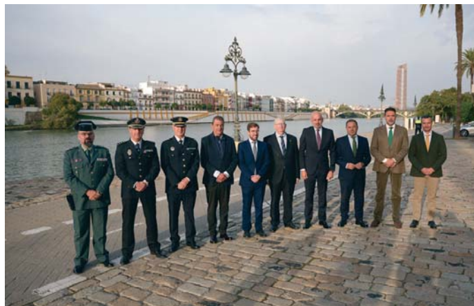
La Magna contará con un dispositivo especial de seguridad, movilidad y de emergencias sanitarias. AVTO

Las zonas más afectadas serán el Casco Antiguo, Triana y Los Remedios, donde se implementarán cortes de tráfico y restricciones para vehículos privados. Para facilitar los desplazamientos, se habilitarán grandes áreas de aparcamiento en la periferia, como la Isla de la Cartuja, Charco de la Pava y los terrenos de