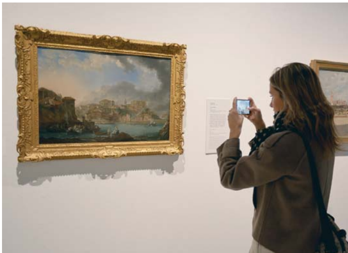
Una mujer fotografía la obra 'Vista de Bermeo', de Luis Paret, en la inauguración de la muestra.

Este trabajo en común es una “muestra más de la apuesta de la Junta por esta