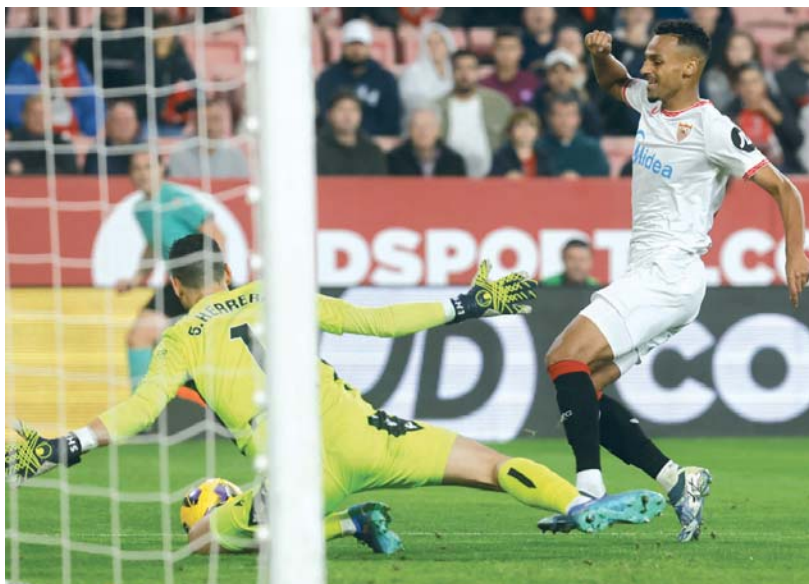
Sergio Herrera tapa el avance de Djibril Sow durante el Sevilla FC-CA Osasuna disputado este lunes en el Sánchez-Pizjuán.

■ El técnico rojillo no ha sido capaz de derrotar a los blanquirrojos en seis duelos disputados