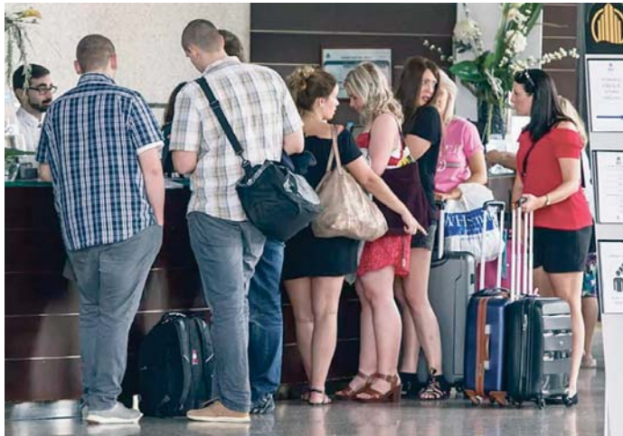
Un grupo de turistas durante su registro en la recepción de un hotel.

Los hoteleros también tienen dificultades para que los