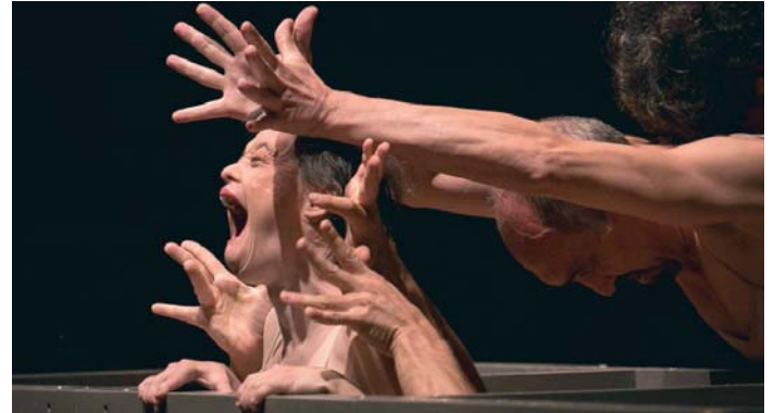
Una de las escenas de 'El Festín de los Cuerpos', con la que han viajado a Alemania e Italia. DANZA MOBILE

La danza es el otro gran aliado de Danza Mobile para la transformación social y como motor para la inserción laboral de personas con discapacidad. Y lo demuestra el calendario de actuaciones de la