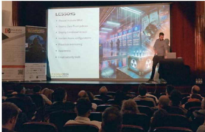
Un momento del encuentro SecAdmin, que se consolida como referente de la ciberseguridad.

La repercusión en redes sociales "superó todas las expectativas", convirtiendo al evento en un tema de conver-