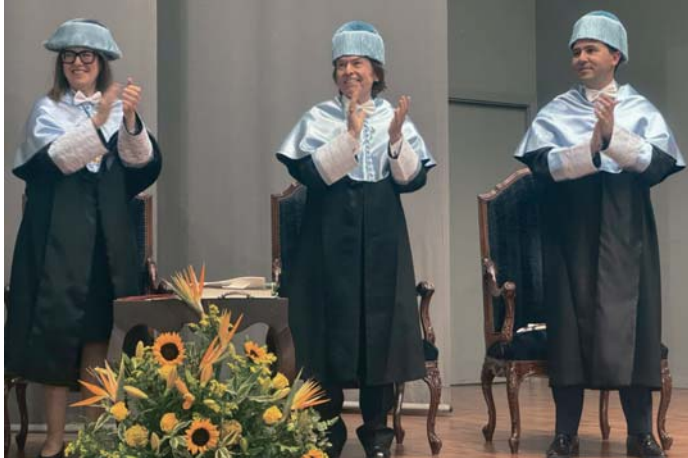
El cantante Raphael reconocido en la Universidad de Jaén.

El linaresno ha definido a su voz como “el mejor aliado” y ha alabado a los “auténticos sastres” que ha tenido en las composiciones, como son los casos de Manuel Alejandro y José Luis Perales. “He seguido un sendero por mi voz y me he mantenido fiel a mí mismo, resistiendo las modas y las