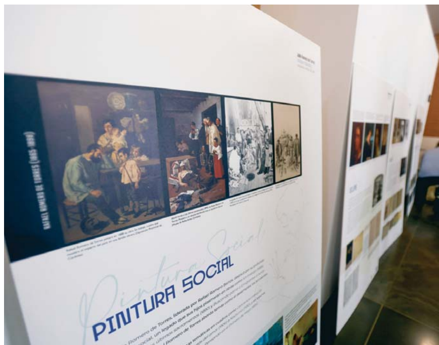
Documentos, fotografías, recortes de prensa e ilustraciones recrean la época del pintor Julio Romero de Torres.