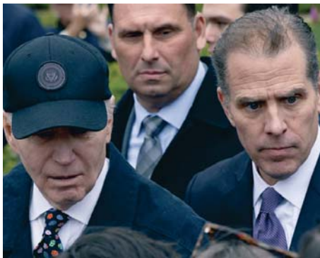
El presidente de EEUU, Joe Biden, y su hijo Hunter Biden.

Hunter Biden había sido declarado culpable de haber