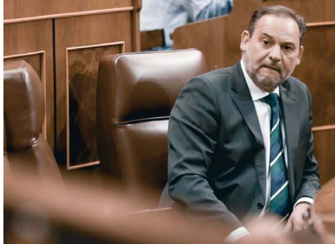
El exministro José Luis Ábalos en el Congreso de los Diputados.

Sin embargo, aclara el juez, la Audiencia Nacional deberá continuar con la investigación respecto a todos los demás imputados -que llegaron a sumar en torno a una veintena-, y también respecto a hechos atribuidos a De Aldama y Koldo García que no guarden relación con Ábalos, como presuntos delitos contra la Hacienda Pública y/o de blan-