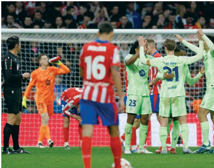
Los jugadores del FC Barcelona celebran la victoria tras el encuentro.

Incidencias: partido de vuelta de las semifinales de la Copa del Rey, disputado en el estadio Metropolitano ante 69.014 espectadores.