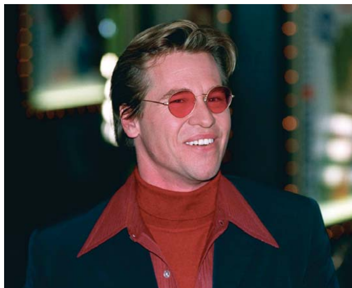
El actor estadounidense Val Kilmer en una imagen de archivo de 1997.

quien dirigió a Kilmer en el filme Twixt (2011), también rindió homenaje al actor: "Val Kilmer era el actor más talentoso ya cuando estaba en el instituto, y ese talento solo creció a lo largo de su vida. Era una persona maravillosa con la que trabajar y fue un placer conocerlo. Siempre lo recordaré".