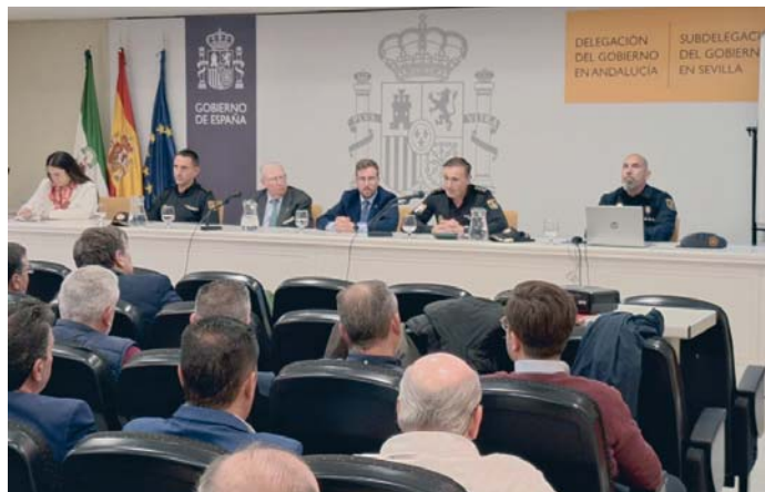
Un momento de la presentación del dispositivo especial de la Policía Nacional en Semana Santa. 56

Como es habitual, ha indicado el subdelegado, "el dis-