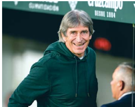
Manuel Pellegrini sonriendo en el derbi sevillano.

Otro que se ha dejado ver en su coche ha sido el Chimy Ávila, quien no se preocupa por su partido contra el FC