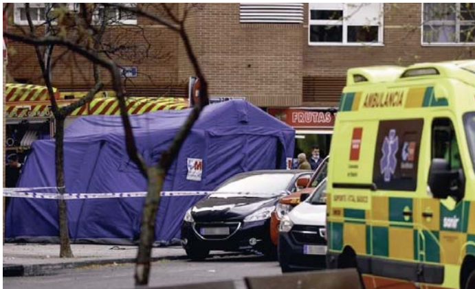
Bomberos y servicios de emergencias en las inmediaciones del garaje de Alcorcón.

Los sanitarios confirmaron la muerte de dos bomberos, que en un principio estaban ilocalizados. Además, 14 más resultaron heridos, uno de ellos de gravedad, que fue trasladado en ambulancia a la Unidad de Quemados del Hospital Universitario de Getafe. Asimismo, trasladaron al Hospital Fundación de Al-