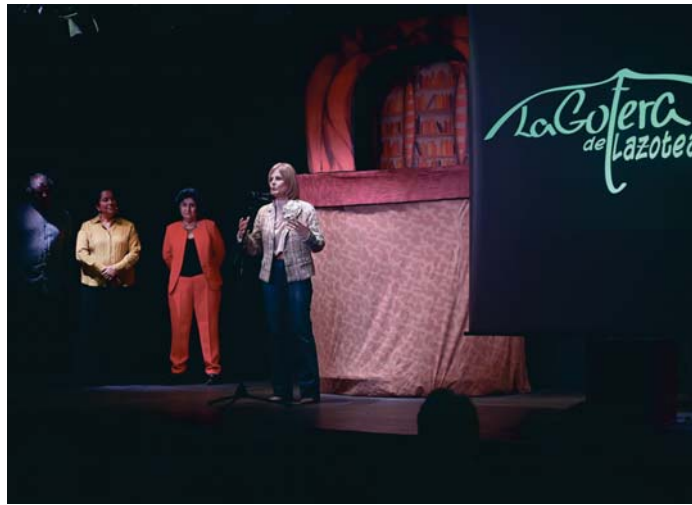
La alcaldesa junto a los promotores del teatro durante su intervención en la inauguración de ayer.