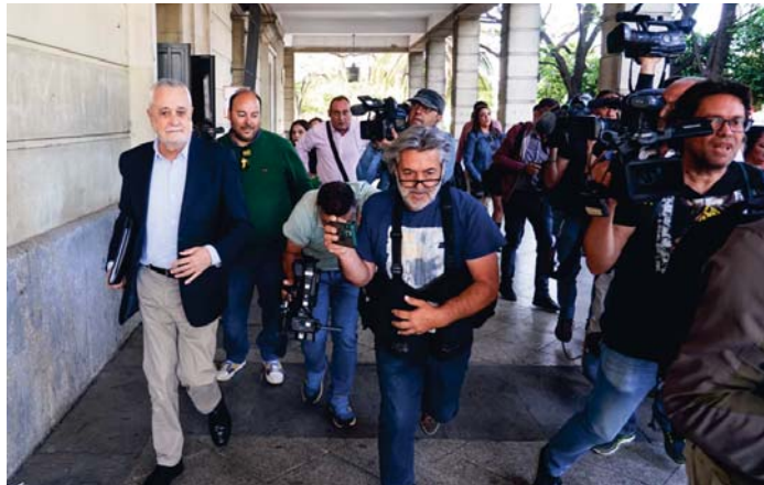
El ex presidente de la Junta José Antonio Griñán llegando a los juzgados.

Así se pronuncian los fiscales de Sevilla delegados de la Fiscalía Especial contra la Corrupción, después de que la Sección Primera de la Audiencia de Sevilla, al sopesar “el posible planteamiento de una cuestión prejudicial de interpretación ante el Tribunal de Justicia de la Unión Europea”; habilítase un plazo de diez días, para que las partes del procedimiento judicial informasen sobre si en este caso, el Constitucional “se ha