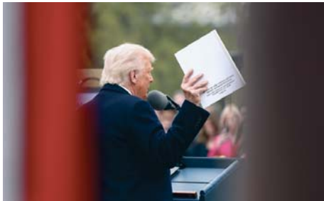
Donald Trump en el jardín de la Casa Blanca.

"Los trabajadores del acero, del automóvil, los agricultores y los artesanos cualificados (...) han sufrido realmente mucho, han visto con angustia cómo dirigentes extranjeros han robado nuestros empleos, cómo unos tramposos extranjeros han rapiñado nuestras fábricas y cómo unos extranjeros carroñeros han destrozado nuestro antaño hermoso sue-