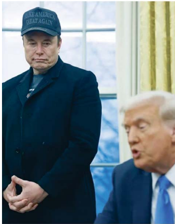
Donald J. Trump y Elon Musk en el Despacho Oval de la Casa Blanca.

Esta edición de la lista se convierte en la primera en superar el umbral de los 3.000 miembros, ya que un total de 3.028 personas de todo el mundo lograron amasar un patrimonio de al menos 1.000 millones de dólares