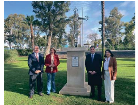
Cruz del Camino de Santiago en Colón.