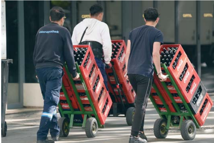
Varios trabajadores de reparto realizan su trabajo en medio de las calles de Sevilla.

También en marzo de 2009 hubo un crecimiento del desempleo que afectó a 1.269 personas, medio año después del