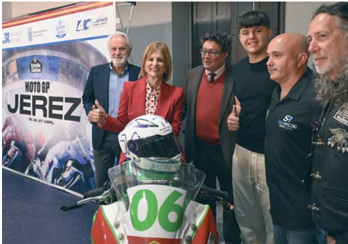
La alcaldesa durante la presentación de las actividades del mundial el pasado viernes.