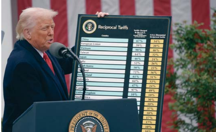
Donald Trump sostiene las tablas tarifarias impuestas a medio mundo.

Donald Trump recordó que el pasado viernes China impuso aranceles de represalia del 34%, “a pesar de mi advertencia de que cualquier país que tome represalias contra EEUU imponiendo aranceles adicionales, además de los ya abusos arancelarios existentes contra nues-