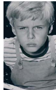
Jay North en Daniel el travieso. CBS

ra con papeles en películas como Zebra in the Kitchen y Maya , además de prestar su voz para programas infantiles como The Banana Splits Adventure Hour . Sin embargo, su éxito inicial no se tradujo en una carrera sostenida en Hollywood. En los años 70, decidió alejarse de la actuación y explorar otros caminos, incluyendo un breve paso por la Marina de los Estados Unidos.