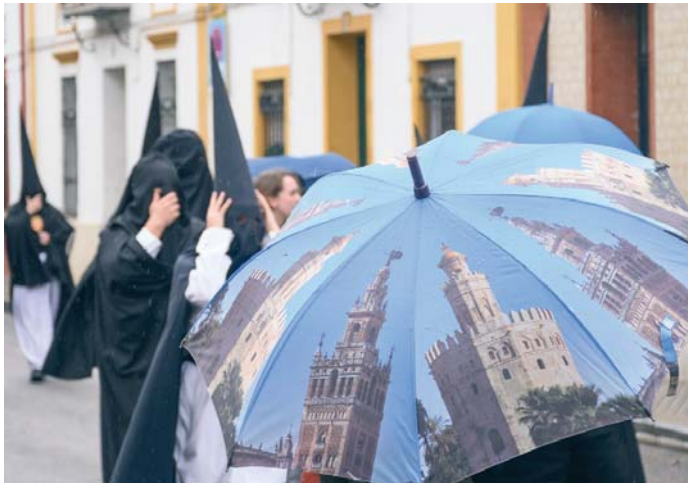
Las lluvias podrían volver a dejar su impronta en la Semana Santa de Sevilla.

El Domingo de Ramos (13 de abril), día clave para el ini-