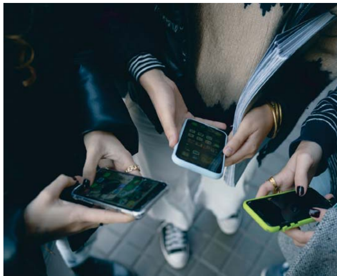
Varios jóvenes hacen uso del teléfono móvil.

Los expertos explican que en estudios previos como el publicado en Environmental Research and Public Health realizados durante el confinamiento de la Covid-19 se concluye que el aumento del tiempo de pantalla, incluido el uso de móviles, tenía consecuencias negativas en la salud mental. Esto incrementa