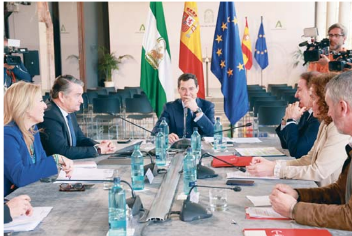
Reunión de Juanma Moreno con CEA, UGT-A y CCOO-A, ayer en Sevilla.

bierno quiere ser “positivo y optimista” porque los productos andaluces son muy competitivos, dada su alta calidad, con el mejor aceite de oliva “del mundo”, de manera que es muy querido y demandado en Estados Unidos.