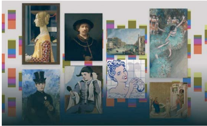
MUSEO THYSSEN BORNEMISZA

En un laboratorio controlado han identificado las emociones predominantes que producen 125 obras de arte que abarcan las principales épocas y estilos presentes de las colecciones Thyssen Bornemisza y Carmen Thyssen. De esta manera, se ha demostrado que los tonos cálidos y las composiciones equilibradas tienden a generar