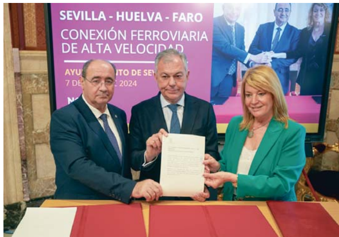
Los regidores de Faro, Sevilla y Huelva renuevan su alianza en un acto en Sevilla. AYT0

Y es que la conexión entre Sevilla, Huelva y Faro permitiría crear una gran comarca transfronteriza de más de 4 millones de habitantes y que recibe 15 millones de turistas al año. Para los firmantes del manifiesto, esta infraestructura no es sólo un medio de transporte, sino el eslabón que falta para consolidar la gran comarca del sur como puerta de entrada a Europa. "Una línea de alta velocidad es también una nueva oportunidad para atraer inversiones económicas y proyectos empresariales a cualquiera