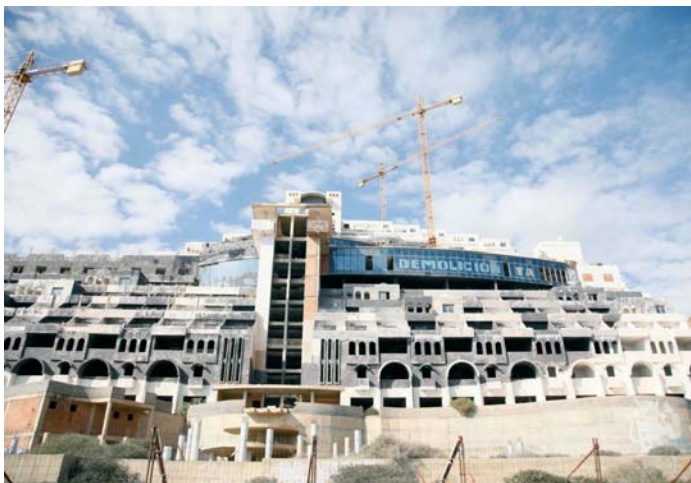
Vista general del hotel ilegal de El Algarrobico.

En esta línea, le remite además copia del informe del técnico y de la modificación parcial del plan general y su adaptación de las normas subsidiarias a la LOUA con el objetivo de dar cumplimiento a la sentencia que le obliga a reclasificar los sectores ST-1 y ST-2, correspondientes a El Algarrobico y El Canillar, respectivamente, para poder garantizar la protección urba-