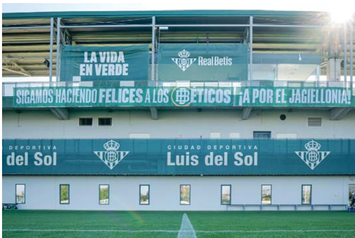
Pancarta desplegada en la Ciudad Deportiva Luis del Sol para motivar a los jugadores del Real Betis.

Sin olvidar que el Domingo de Ramos se enfrentan a un rival directo como es el Villarreal, con quienes están empatados a 48 puntos.