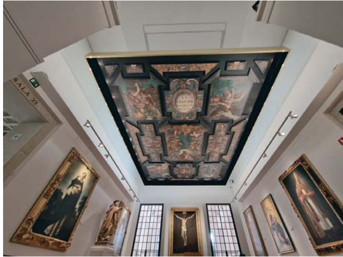
La colección permanente del Museo de Bellas Artes una nueva obra de la escuela sevillana. MBAS

La obra es de especial interés por su contenido, un fresco de la vida cotidiana de la Sevilla del siglo XVIII en la Alameda