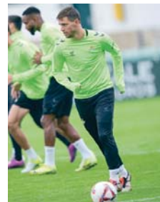
Lo Celso entrena con el Betis.

Las malas noticias en este parón internacional para el técnico chileno han sido las lesiones de Johnny Cardoso y Nobel Mendy. El americano estará de baja hasta mediados de diciembre, lo que supone un contratiempo para el once de gala de su entrenador y, en caso de que el Tottenham estuviera finalmente interesado, una futura venta.