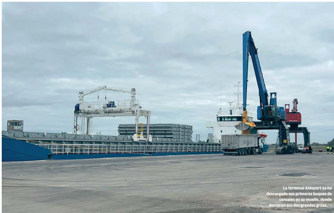
La terminal Aldeport ya ha descargado sus primeros buques de cereales en su muelle, donde destacan sus dos grandes grúas.

VENTAJAS Pueden descargar dos buques a la vez, tiene 15.000 m2 de almacenaje y espacio industrial