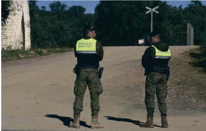
Militares acordonando la zona.

El juez dictó el pasado 29 de julio pasado un auto de procesamiento contra seis mandos de la base militar de Cerro Muriano, donde tiene su sede