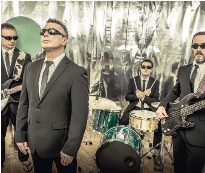
Los 'Chanclas', dispuestos a celebrar una gran fiesta en Sevilla por sus 35 años de carrera.

Asegura que para mantenerse y contar con ese apoyo incondicional del público pese al paso del tiempo es "muy importante la humildad y la salud musical que el grupo lo demuestra en directo" porque "la música tiene dos vertientes muy diferentes, una es tu discografía, lo que tu grabes y