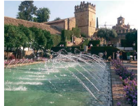
El Alcázar de los Reyes Cristianos de Córdoba.

La productora ya anunció en Fitur la temática de la nueva edición del espectáculo, que versará sobre el encuentro de Colón con los Reyes Cristianos en el Alcázar y cómo este evento fue la semilla de la posterior aventura de las Indias. El equipo de Letsgo trabaja en el desarrollo creativo del espectáculo. Han avanzado que la composición musical será especialmente singular para este espectáculo, añadiendo una capa más de contenido histórico al relato.