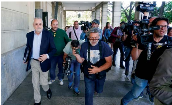
El ex presidente de la Junta de Andalucía, José Antonio Griñán.

Ello, después de que el TC, con una mayoría de siete magistrados a favor y cuatro en contra, admitiese parcialmente los recursos de amparo