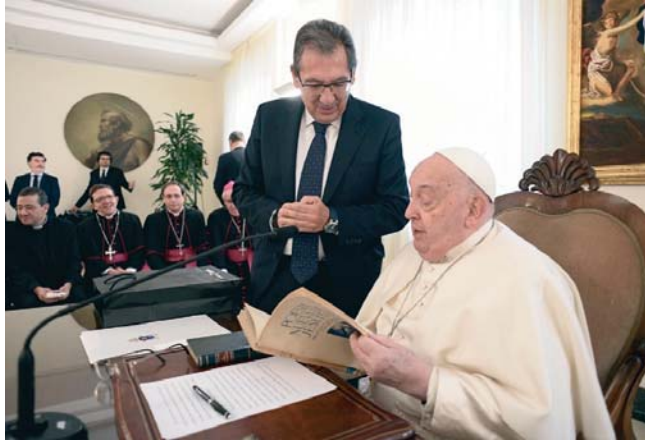
El presidente de la Fundación Cajazol entrega uno de los libros al Papa Francisco.