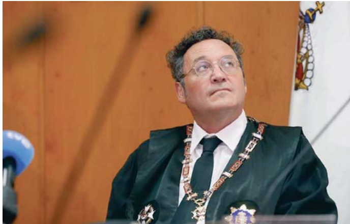
El Fiscal General del Estado, Álvaro García Ortiz.

Además, la UCO informa al TS de que tampoco ha sido posible conseguir la información acumulada en la cuenta personal de correo electrónico de García Ortiz porque "ha si-