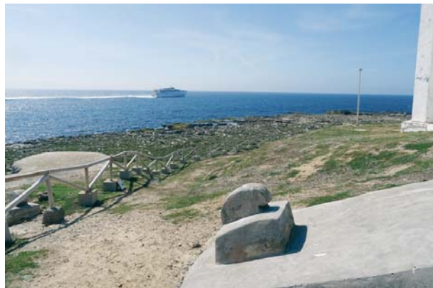
Vista al Estrecho de Gibraltar desde la tarifeña Isla de las Palomas. MONTI MON

El proyecto ‘Vestigium’ surge con la finalidad de investigar y fomentar la investigación y difusión de aquellos vestigios poco estudiados que se encuentran entre el mar y la tierra, en la parte del litoral situada entre las máximas y mínimas mareas