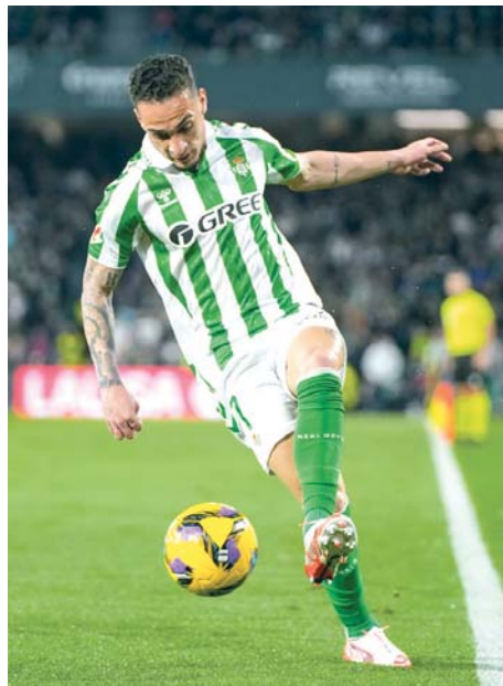
Antony controlando el balón durante el Real Betis-Athletic de Bilbao.

El técnico chileno ha tenido claro que el sitio de Abde era