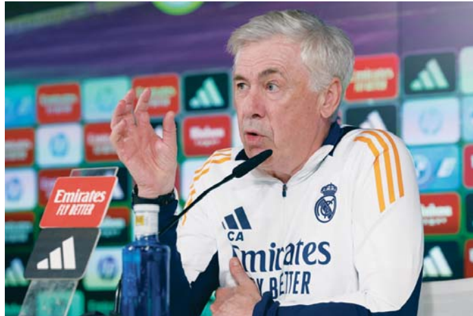
El entrenador del Real Madrid, Carlo Ancelotti.

Ancelotti realizó una encendida defensa de la temporada del brasileño Vinicius, objeto de las críticas en las úl-