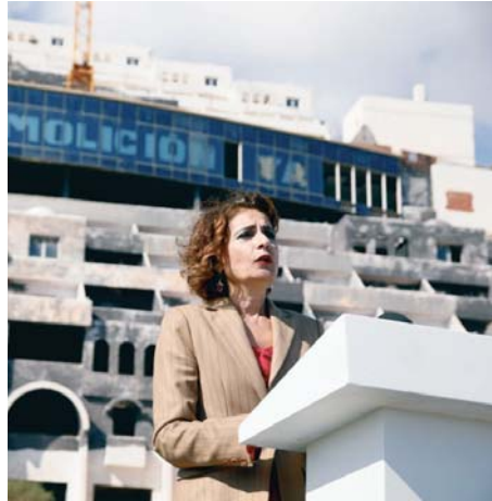
María Jesús Montero, en Carboneras.