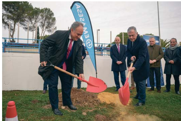
Un momento del acto de colocación de la primera piedra de la planta de ozonización de Emasesa. AVTO

ción del agua en un contexto en el que las sequías son cada vez más frecuentes, más intensas y más prolongadas en el tiempo. "La última sequía ha sido una de las peores que se recuerdan, con una duración de seis años. No sabemos cuánto tardará en llegar la próxima ni cuánto durará, pero sí sabemos que debemos estar preparados para cuando vuelva", se destacó durante el acto. En este sentido, se subrayó que el deterioro de la calidad del agua bruta, ya sea por la sequía o por lluvias to-