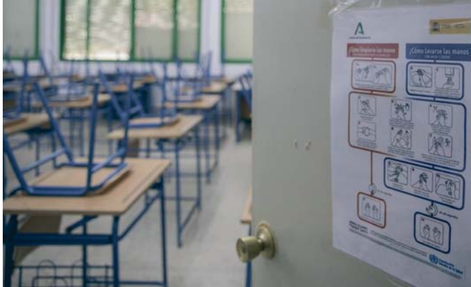
Imagen de archivo del aula de un colegio.

Mientras que en algunas autonomías como Galicia y