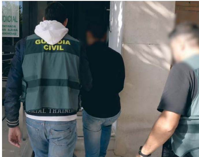
Un momento del traslado del presunto autor del homicidio a dependencias de la Guardia Civil. DGGC