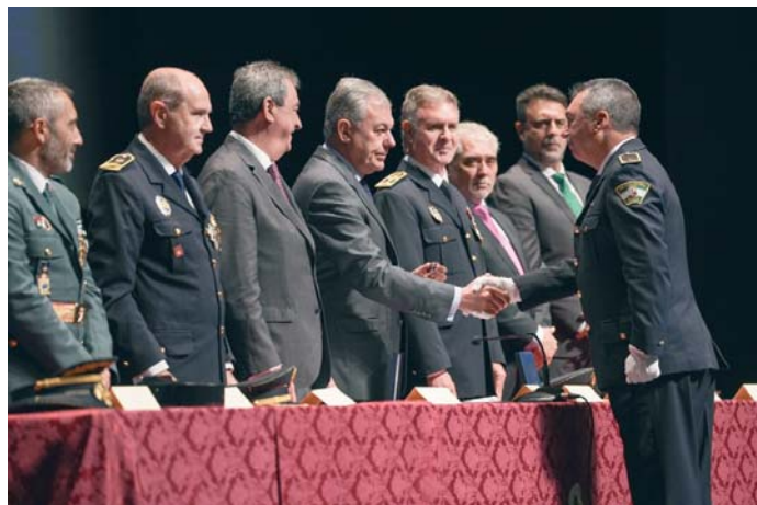
Un momento de las condecoraciones a los agentes, que este año ha recaído en 170 policías locales. AVTQ

El Palacio de Congresos Fibes ha acogido la celebración de esta efeméride en la que se ha hecho balance del año de trabajo de la Policía Local de