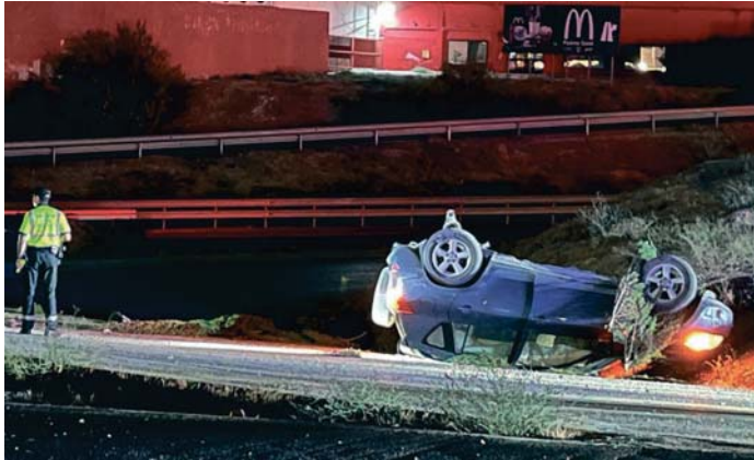
Estado en el que quedó un vehículo que se salió de la vía. VIVA

Delos 6.500 fallecidos en accidentes de tráfico nocturnos entre 2013 y 2023 más de