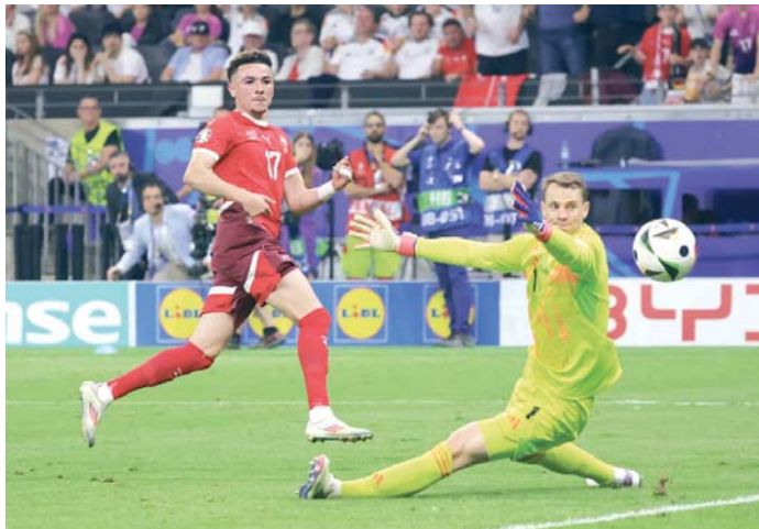
Rubén Vargas falla una ocasión ante Neuer durante el Suiza-Alemania de la Eurocopa del pasado verano.