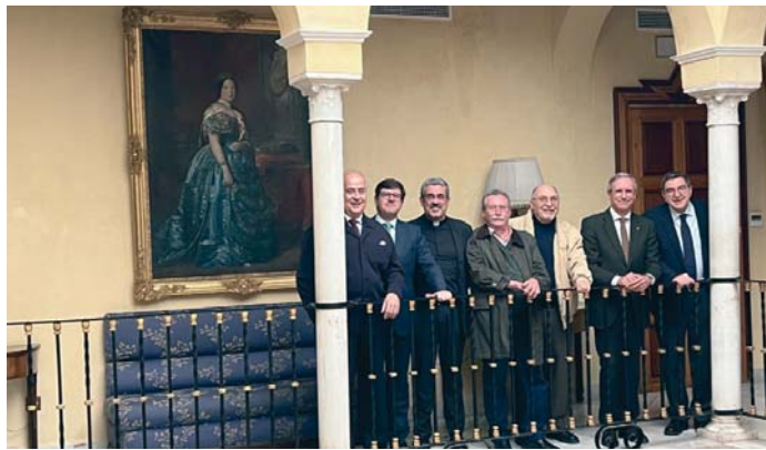
Los miembros de Adepa posan con los galardonados bajo la atenta mirada de la reina Isabel II. CT

La asociación busca dar visibilidad a aquellos que, de manera silenciosa pero efectiva, trabajan en la sombra para preservar edificios, monumentos y tradiciones que forman parte del alma de Sevilla y que la preservan como "la joya que es" y no como "el parque de atracciones" en el que se ha convertido la ciudad debido al turismo masivo. Además, buscan disipar la