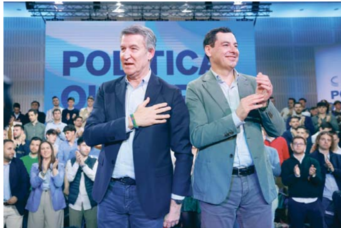
Juanma Moreno (d), y el presidente del PP, Alberto Núñez Feijóo, clausuran la Interparlamentaria del PP.

También tuvo palabras de apoyo hacia el alcalde de Sevilla, José Luis Sanz, apuntando que es el alcalde que esta ciudad "necesitaba hace años y el que tendrá durante muchos años".