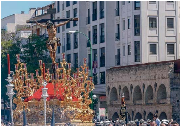
El Miércoles Santo cambia el orden de las cofradías en carrera y La Sed ocupará el tercer puesto.

El Sábado de Pasión también presenta cambios. San José Obrero retrasa su entrada cinco minutos, a las 00.40 horas. Por su parte, el Divino