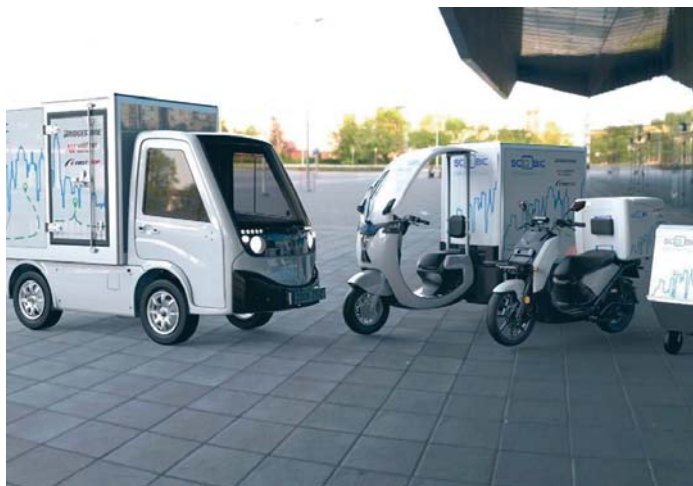
Algunos de los vehículos eléctricos y de primera milla por los que ha recibido las ayudas. SCOOBIC

No es la primera vez que este ministerio concede una ayuda a la empresa y también dentro del mismo programa. En noviembre de 2023 el Ministerio de Industria concedió, dentro de la segunda tanda del PERTE VEC II para la producción de vehículos eléctricos y sus componentes, una ayuda de 3,38 millones de euros, de los 9,65 subvencionables, a Scoobic Urban