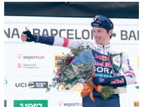
Primoz Roglic celebra en el podio la victoria.

A sus 35 años, Roglic se postula como uno de los favoritos para enfundarse la maglia rosa en el Giro que empieza el 9 de mayo en Albania.