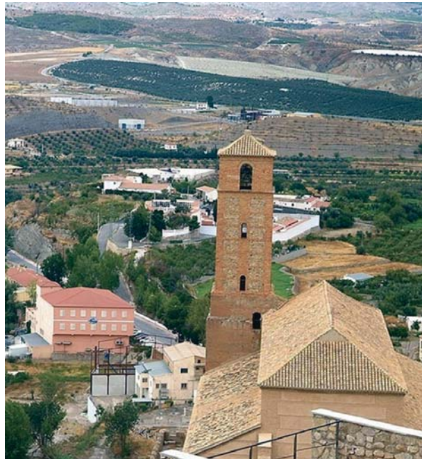
JUNTA DE ANDALUCÍA

Además de fijar la población al territorio, según la Junta, es “clave” atraer nuevos vecinos porque el envejecimiento de la población generalizado en todo el mundo occidental “también acecha a Andalucía”