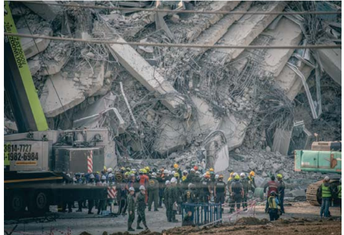
Tareas de rescate en Bangkok tras el colapso de un edificio.

Países como China han comenzado a desplegar en las últimas horas a sus equipos de expertos en salvamento mientras que la Unión Europea ha anunciado 2,5 millones de euros en ayuda para Birmania para los afectados por el terremoto que se ha dejado sentir también en la veci-