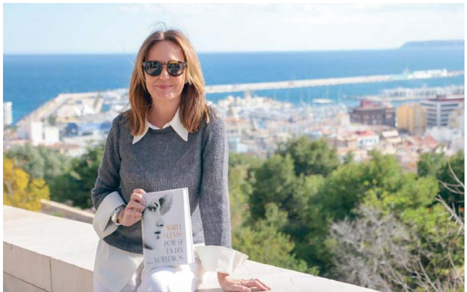
JAVIER OCAÑA - EDITORIAL PLANETA

“Estamos mucho más protegidas que las mujeres de ese pasado. Ahora, que no hemos llegado al nivel de protección deseable y absoluto, también es cierto”