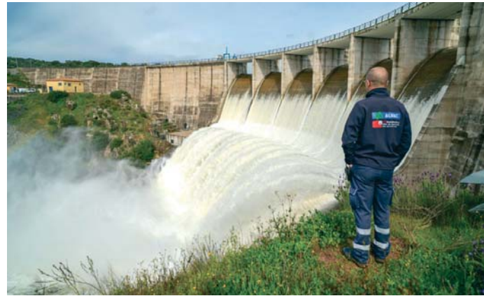
El pantano de Melonares, el más grande que existe en la provincia, desembalsando agua.

En esta situación de bonanza hídrica sin precedentes, el Observatorio del Agua de Emasesa acaba de publicar el segundo número de 'Las claves del agua', su revista técnica, cuyo tema central versa en esta ocasión sobre un asunto de vital importancia: la gestión de la sequía.