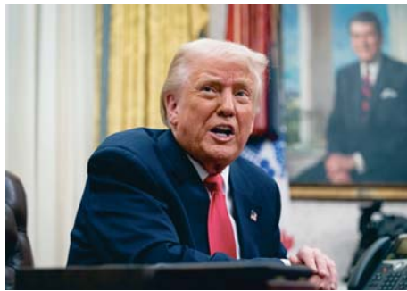
El presidente estadounidense Donald Trump.

La decisión de Washington incluye a la petrolera estadounidense Global Oil Terminals, propiedad del millonario y donante del Partido Re-