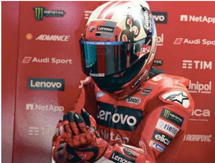
Marc Márquez, tras acabar por los suelos, volvió al box de forma prematura.

El supercampeón del mundo pudo regresar a carrera pero con la moto muy dañada (sin el estribo del lado derecho), lo que a la postre le obligó a abandonar.