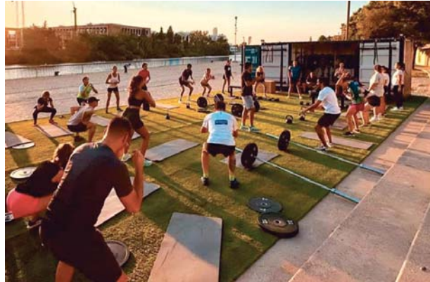
Personas entrenando en un contenedor de los que caracterizan a Supercubo.

Además, pone el foco en la sostenibilidad del proyecto, basado en la reutilización de contenedores y en el uso de energía solar. "Un gimnasio tradicional con-