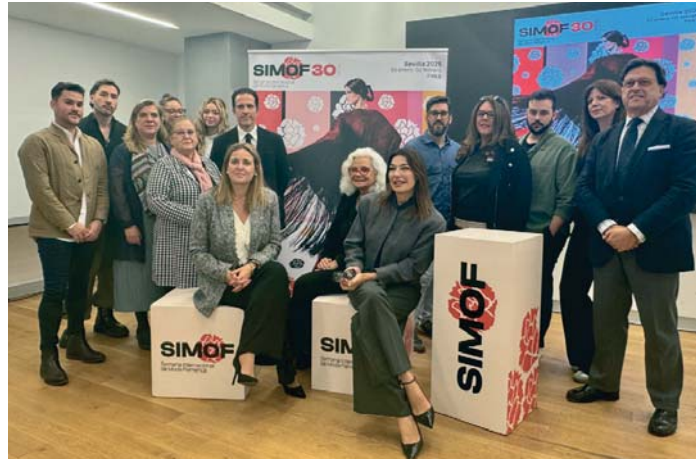
Un momento de la presentación de la nueva edición de Simof, que cumplirá las tres décadas.

Asimismo, la edil de Turismo y Cultura ha manifestado que “durante todo este tiempo, la Semana Internacional de la Moda Flamenca se ha ido consolidando en el panorama de la moda nacional, ha experimentado un notable crecimiento en cuanto a participación y público, ganando prestigio y visibilidad, y ha multiplicado su repercusión en los medios de comunicación hasta hacerse un espacio propio en el calendario de la temporada y convertirse en evento de refe-