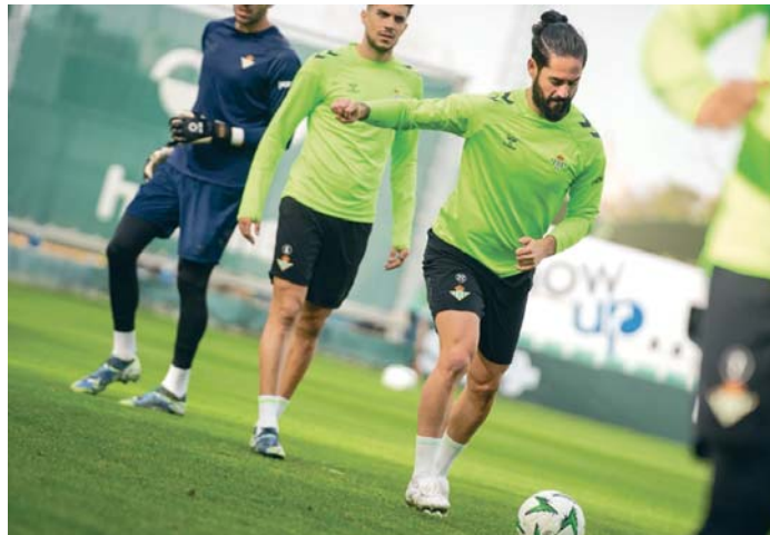
Isco Alarcón vuelve a pisar el césped de la Ciudad Deportiva Luis del Sol junto al resto de sus compañeros.

El regreso del futbolista de Arroyo de la Miel sigue antojándose vital para el técnico