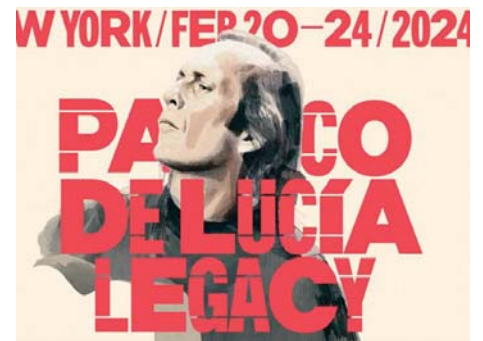
Detalle del cartel promocional de la docuserie.