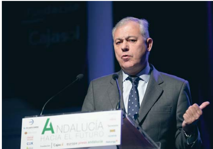
El alcalde de Sevilla, José Luis Sanz, durante la inauguración del foro Andalucía hacia el futuro.

El alcalde apuntaba que se trata de una ciudad que está en marcha y que mira al futuro. "Tiene un presupuesto, un horizonte de ciudad y un horizonte claro al que quiere llegar", subrayaba, definiendo como "raro" el de 2024 por aprobarse en agosto pero con un grado de ejecución de "más del 70%, mientras que las cuentas para 2025 ascienden a 1.058 millones de euros, con una apuesta "clarísimamente por los servicios públicos y por esos servicios muni-