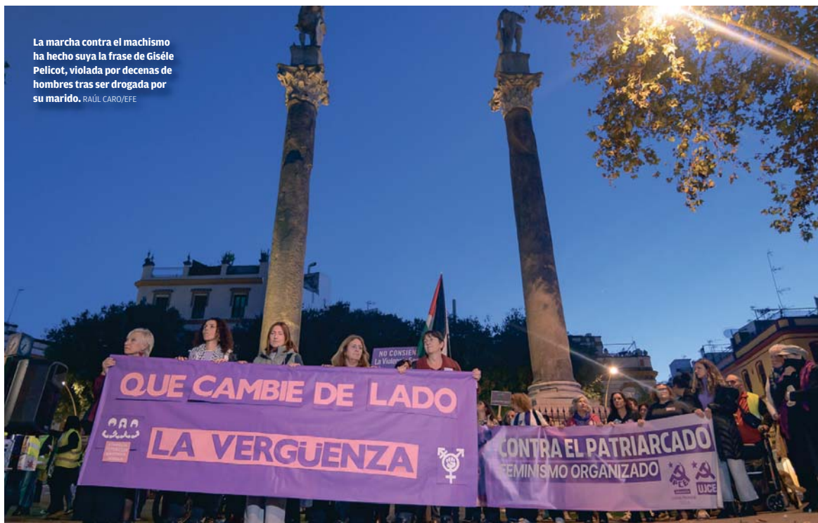
La marcha contra el machismo ha hecho suya la frase de Gisèle Pelicot, violada por decenas de hombres tras ser drogada por su marido.

MENORES El presidente de la Junta aboga por “cortar de raíz” las actitudes machistas en los jóvenes