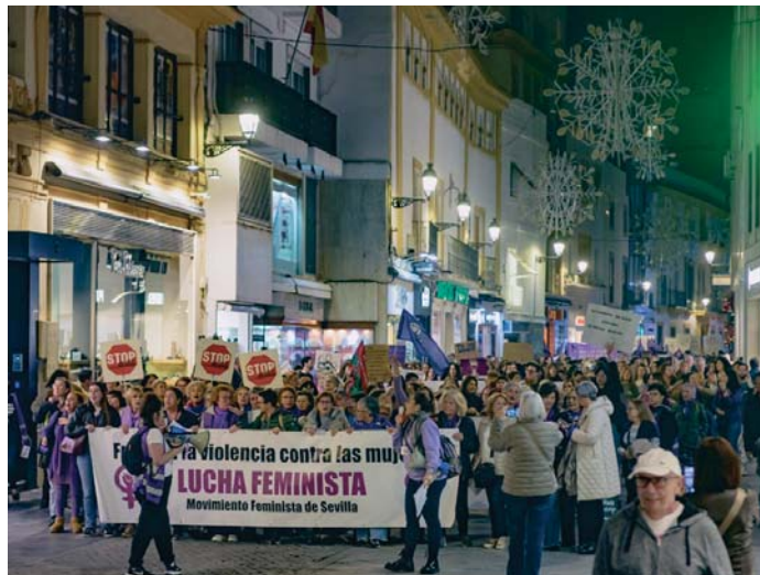
Sevilla volvió de nuevo a echarse a la calle para clamar contra la violencia machista. EFE

Fernández ha defendido que “todas las leyes importantes que han dado igualdad a la mujer, le han dado justicia y han permitido avanzar a este país, siempre han llevado firma de presidentes socialistas”, destacando los 20 años de la ley inicial contra la violencia de género, “que nació del seno de un partido que promulga la igualdad por encima de todo y promulga el feminismo, como es el Partido Socialista”, según ha defendido.