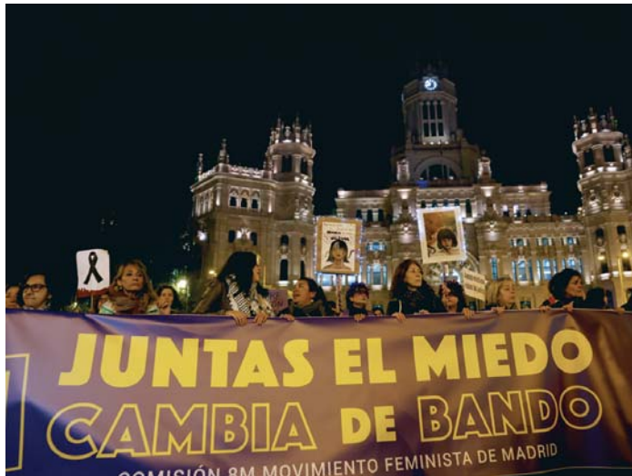
Grupos de mujeres participan en la manifestación convocada por la Comisión 8M en Madrid.

REDACCIÓN. EFE | Miles de personas han recorrido las calles de numerosas ciudades, de Barcelona a Toledo, Valencia o Sevilla, pasando por Madrid, en el Día Internacional contra la Violencia contra las Mujeres, que suma ya 41 víctimas en España, a la espera de confirmar un último crimen, el de una adolescente de 15 años. El lema escogido este 25N ha sido que la vergüenza cambie de bando, con el caso Pelicot -la mujer que fue drogada por su marido para que decenas de hombres la violaran- como telón de fondo.