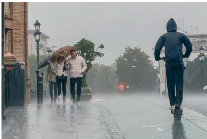
Los chaparrones salpicaron una jornada extraña, en la que la ciudad estuvo a medio gas.

DESPLAZAMIENTOS Se vieron reducidos en un 30% sin actividad lectiva y por el teletrabajo