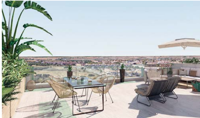
El Conjunto Residencial Edificio Cielo de Tomares ofrece unas vistas inigualables. GRUPO Q

Con una población de más de 25.000 habitantes, Tomares destaca también por su vibrante vida cultural, con un programa de más de 300 actividades anuales, que incluye teatro, música, literatura y mucho más. En el ámbito deportivo, el municipio cuenta con modernas instalaciones donde más de 10.000 personas practican deportes a