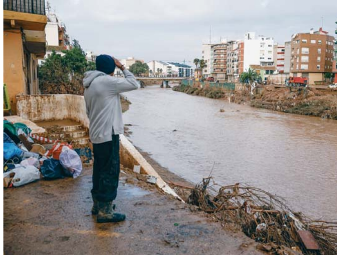
Un hombre observa el caudal del Barranco el Poyo este jueves en Paiporta (Valencia).