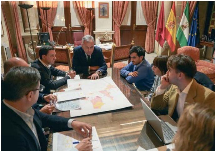
La reunión del alcalde con los vecinos del barrio de Pino Montano sobre la Ronda Urbana Norte.

Durante esta reunión, el alcalde ha asegurado que “el Ayuntamiento no ha abandonado a los vecinos”, que recientemente lamentaban sus declaraciones avisando de que había prometido el soterramiento; y ha destacado que “la mayor inversión en movilidad para los próximos años se está haciendo en esa zona”. Al hilo de ello, ha de-