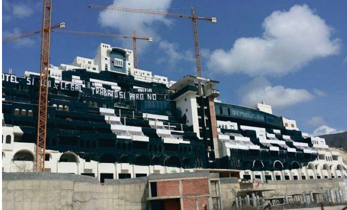
El Algarrobo, donde se construyó el polémico hotel.

Con esta respuesta a una de las alegaciones de la Junta de Andalucía, el técnico que lo redacta incide en que el objetivo de la misma es cumplir la sentencia de 2016 del TSJA, ratificada dos años más tarde por el Tribunal Supremo (TS), que obliga a declarar no urba-