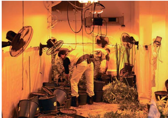
Uno de los registros realizados en una de las siete viviendas que se han inspeccionado.