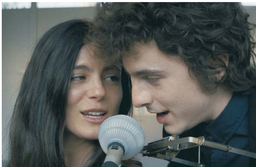
Monica Barbaro, como Joan Baez, y Timothée Chalamet, como Bob Dylan, en un momento del filme.