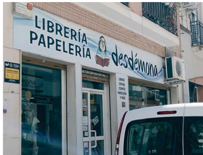
Fachada de la librería 'Desdémona' en Huelva.

Así se ha pronunciado la editorial después de que la Fiscalía de Barcelona presentara un recurso de apelación contra la decisión del titular del Juzgado de Primera Instancia 39 de Barcelona, que el lunes denegó la medida cautelar solicitada por la Sección de Menores de la Fiscalía de Barcelona, que pedía la suspensión provisional de la pu-