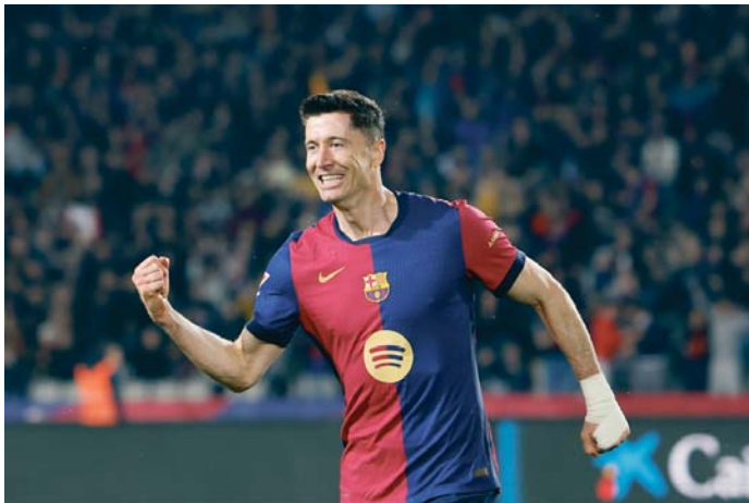
Robert Lewandowski celebra su gol, tercero del equipo blaugrana ante Osasuna.