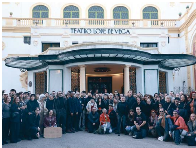
La concentración ante el Teatro Lope de Vega reclamando la reapertura del histórico espacio.

na se procederá a la puesta a punto de butacas, moquetas y entelados con telas ignífugas con los trabajos de desmontaje; y el próximo año concluirán los trabajos de