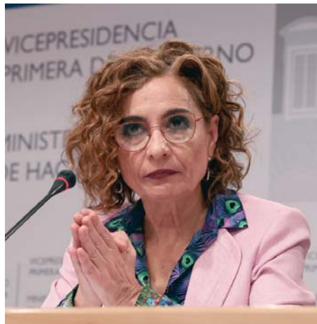
La vicepresidenta primera, María Jesús Montero.

“No tienen argumentos para decir por qué plantean un no a la quita de la deuda”, se reafirmó Montero en su análisis del comportamiento del