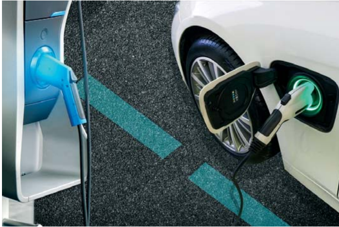
La infraestructura de recarga eléctrica sigue siendo escasa por las trabas administrativas.