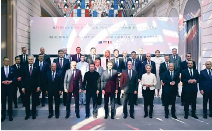
IMAGEN DE UNIDAD. La importante asistencia de líderes en esta ocasión -acudieron una veintena de miembros de la UE así como Reino Unido y Noruega y representantes de Turquía y Canadá- envía una señal de unidad en torno a Ucrania así como un mensaje a Rusia de que Europa contribuirá que una vez haya un acuerdo de paz, esta sea permanente.

Macron explicó que dichas tropas “no pretenden ser fuer-