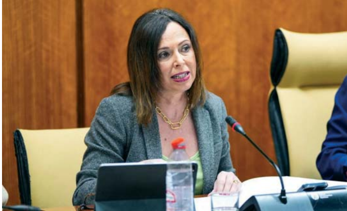
La consejera de Fomento, Articulación del Territorio y Vivienda.

El balance expone que se han ejecutado desde diciembre de 2023 un total de 30 obras de emergencia, “con una inversión que supera los 30 millones de euros para resolver los efectos de los fuer-