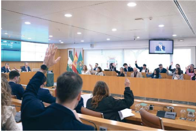
Un momento de votaciones durante la sesión plenaria de la Diputación Provincial de Sevilla.