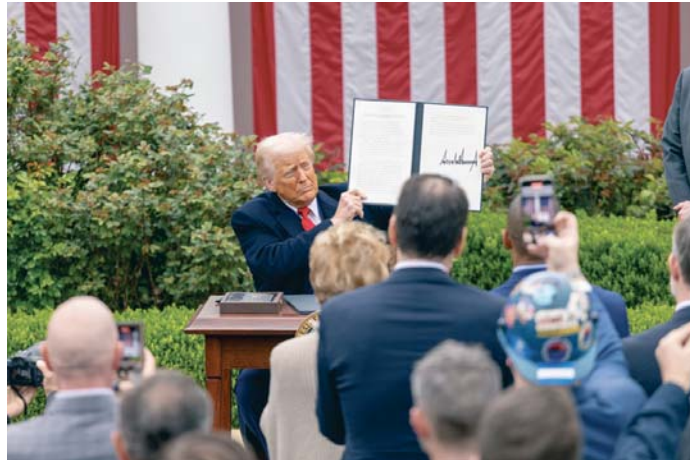
Donald Trump muestra a los asistentes su firma en los decretos gubernamentales.

A su vez, Trump cuantificó en 6 billones de dólares (5,525 billones de euros) las inversio-