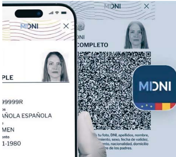
MINISTERIO DEL INTERIOR

La app permite ya a los ciudadanos identificarse de forma presencial en diferentes situaciones cotidianas como el registro en un hotel, el alquiler de un coche o para ejercer el voto en unas elecciones, así como para acreditar si se es mayor de edad