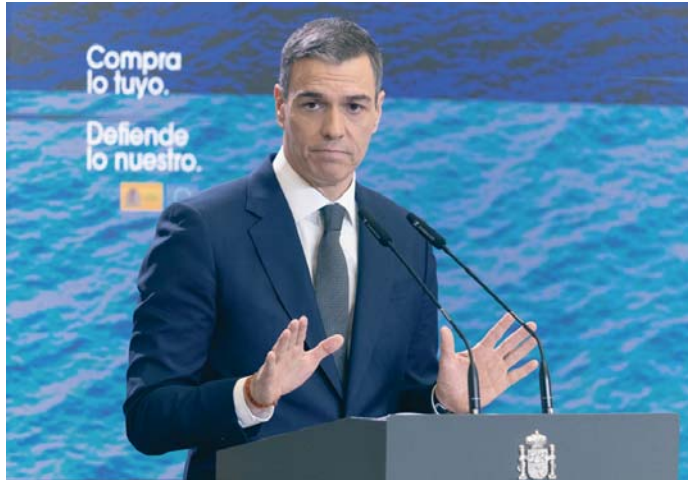
El presidente del Gobierno, Pedro Sánchez, durante la rueda de prensa en La Moncloa.

“Es esencial que en este tema no haya divisiones impostadas ni tampoco cálculo político. Si queremos superar este desafío tenemos que ir todos a una en España y en Europa defendiendo lo que