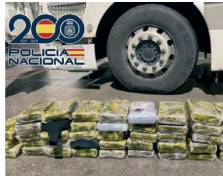
Operación policial.

Con estos datos, se estableció un control en una gasolinera situada en El Molar, donde el transportista, junto a los conductores de los otros dos vehículos que lo acompañaba, realizaba su descanso obligatorio. Ante estos hechos, fueron detenidos los tres responsables del transporte. Al mismo tiempo, en las naves donde se ocultó la sustancia fue detenido el guardés de la empresa.