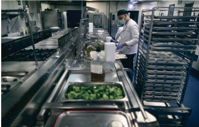
Los restaurantes deberán facilitar envases a sus clientes para que se lleven las sobras.

La norma consta de un total de 23 artículos. Promueve la donación de alimentos sobrantes en el sector de la distribución, obliga a los establecimientos de más de 1.300 metros cuadrados a disponer