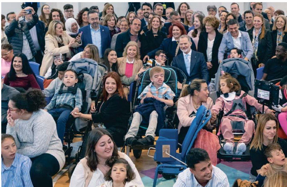
El rey, durante la entrega del Premio Princesa de Girona Escuela a Centro de Educación Especial Purísima Concepción de Granada.

En su recorrido, su majestad el rey, que visitó este centro de las Hermanas Hospitalarias de Granada, en la zona norte, antes de inaugurar en el Palacio de Congresos el Foro sobre el Futuro del Mediterráneo, conocido entre otras estancias el taller de economía circular, donde le aguardaba un mosaico con material reciclable de los reyes con la princesa Leonor vestida en rojo y la infanta Sofía, en azul. “Gracias por ese esfuerzo”, indicó Felipe VI, “cada pieza y cada detalle tie-