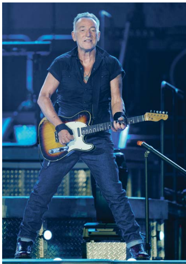
Imagen del 11 de julio de 2023 de un concierto en Copenhague.

El cantante, guitarrista y compositor estadounidense Bruce Springsteen, y su E. Street Band, durante el concierto que ofreció el pasado 12 de junio en el estadio Metropolitano, en Madrid.