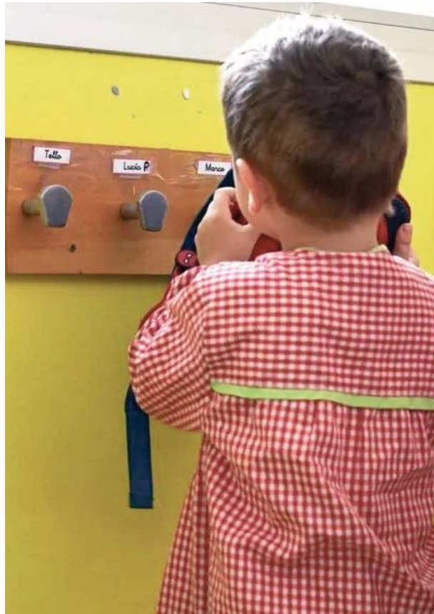
Imagen de archivo de un niño en su primer día de curso escolar.

Las regiones más ricas, con mayor nivel de renta per cápita, como Euskadi, Comunidad de Madrid, La Rioja, Navarra y Castilla y León, cuentan con más alumnado en el modelo concertado