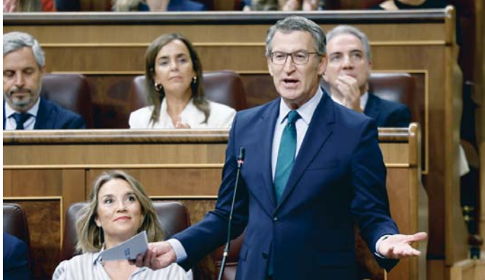
El presidente del PP, Alberto Núñez Feijóo, interviene en la sesión de control al Gobierno.

Feijóo señaló que dicen que Sánchez "es el gran jefe" y dijo que ya empiezan a "saber por qué", aludiendo a su "ofensiva contra jueces, periodistas y medios de comunicación" en este inicio del curso político. "Lo que usted llama regeneración democrática realmente es un plan de censura. Ha pasado de tener problemas con la verdad a tener problemas con los que la cuentan", enfatizó. "Mientras usted persigue a los periodistas, yo propongo