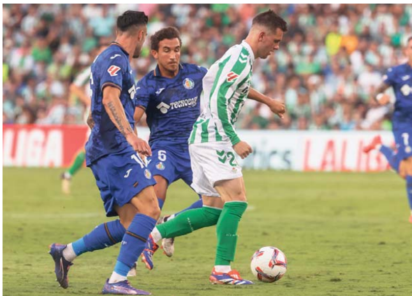
El futbolista del Real Betis, Giovanni Lo Celso, durante el partido contra el Getafe de la jornada 3 de LaLiga.

El equipo de Manuel Pellegrini controló el balón durante todo el encuentro.