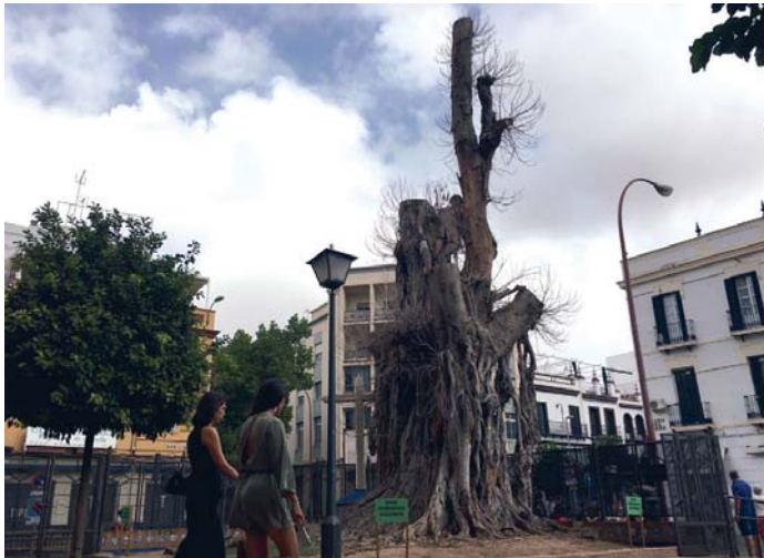
El estado actual del ficus de San Jacinto, que el Ayuntamiento ya lo ha declarado muerto.