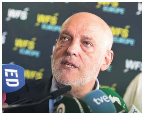
Javier Tebas en el World Football Summit.

Sin embargo, Tebas asegura que la directiva sevillista “no tienen que tener prisa, sino gestionarlo bien”, alegando además que “hay un gran