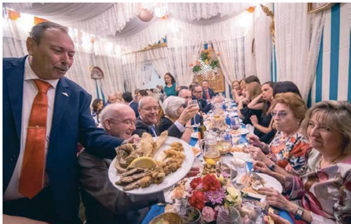
Una caseta se prepara para recibir a los socios de las casetas para la cena del pescaíto.