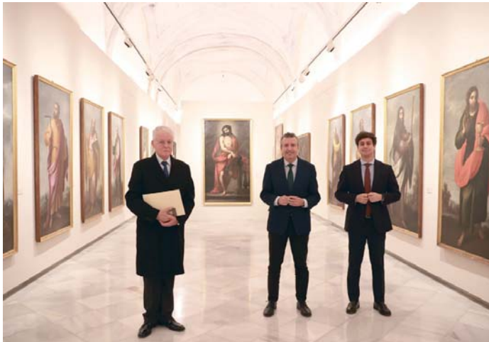
Inauguración de la muestra 'Patrimonio Histórico de la Diputación 1500-1900. Arte y Beneficencia'.

“Hoy entregamos un tesoro a Sevilla, una gran joya, que es seguir avanzando en San Luis de los Franceses, pues la Diputación tiene tres grandes objetivos. Uno, asistir a los pueblos. En segundo lugar, las políticas supramunicipales, que son las carreteras, los residuos, los transportes, los bomberos, todo un escenario