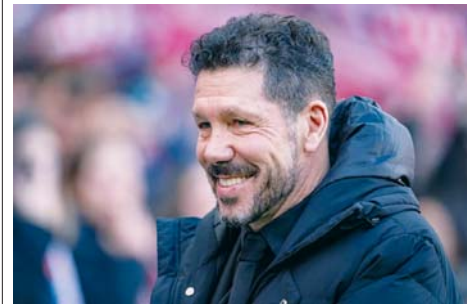
Diego Pablo Simeone, técnico del Atlético de Madrid.

Respecto al Elche, dijo que “viene haciendo una temporada muy buena, jugando un fútbol ofensivo, alegre, importante”. “Sabemos que vamos a enfrentar a un rival que está trabajando muy bien en segunda división, que está compitiendo, creo que lleva 10 partidos sin caer derrotado y con mucha confianza, como se lo ve. Una marca buena hasta ahora”, elogió.