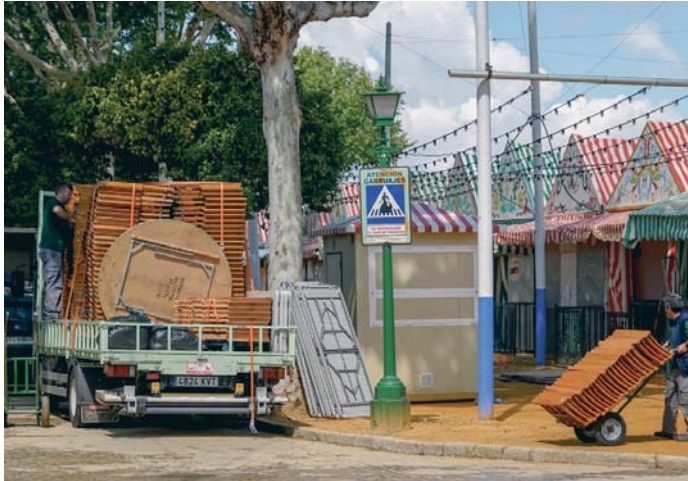
Varios trabajadores durante las labores de montaje de las casetas de la Feria de Abril.

Los caseteros, que “acatarán la decisión” pese a que