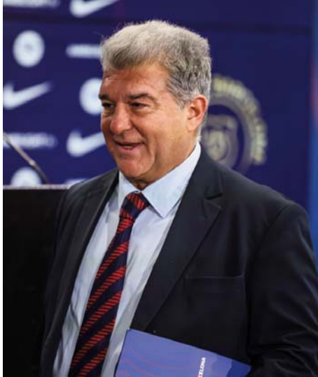
El presidente del Barcelona, Joan Laporta, en rueda de prensa.

“Nosotros presentamos la documentación en LaLiga el 27 de diciembre, la enviamos dentro del plazo, lo que pasa es que durante el 28, 29, 30 y 31 nos pidió que la completáramos. Pensábamos que ya teníamos el 1:1, pero LaLiga nos pidió unos requisitos adicionales que no estaban incluidos en la normativa, según nuestra opinión y no nos lo dio”, explicó Laporta en rueda de prensa. Por ello, solicitaron la extensión de la licencia de los dos futbolistas a la RFEF, que les dijo que “no había ningún inconveniente” en tramitarla, aunque les comunicó que no estaban en el 1:1. “LaLiga y la RFEF nos dijeron que se aplicaba un artículo que estaba obsoleto, cuya finalidad es la estabilidad de la competición y pensamos que no entrábamos en ese supuesto, hecho para evitar que jugadores y clubes se inscribieran en varias ocasiones en una