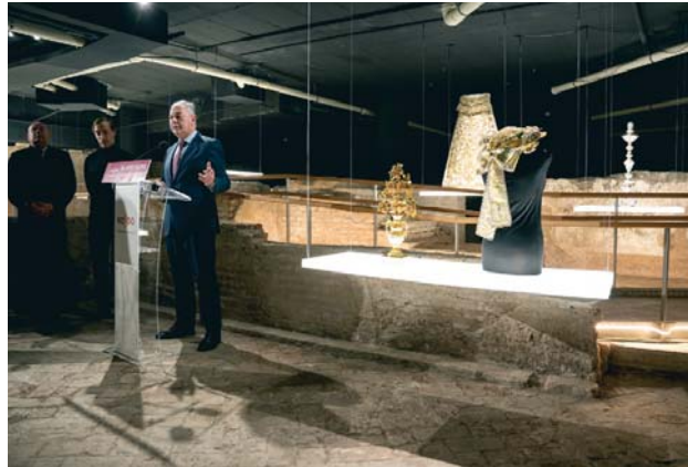
El alcalde de Sevilla interviene en la presentación de la reapertura del castillo.