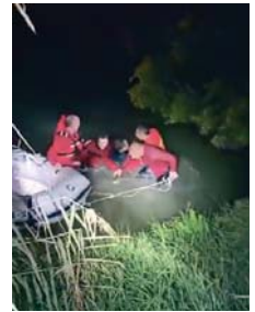
El momento del rescate.

El rescatado, del que no se han facilitado datos, fue ingresado en el hospital aquejado de hipotermia