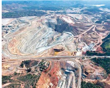
Explotación minera de Riotinto. W.H.

Y como remate final, Ecologistas en Acción denunció que se vulneraba la planificación hidrológica, ya que se supera con mucho las cantidades destinadas al uso industrial minero en la comarca, según lo