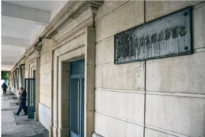
Fachada de los Juzgados de Sevilla.

En un auto emitido este pasado lunes y recogido por Europa Press, el magistrado José Antonio Gómez Díez, como nuevo titular del Juzgado de Instrucción número 13, aborda un recurso de reforma del Grupo socialista, subsidiario de apelación ante la Audiencia de Sevilla, contra el auto emitido el pasado 7 de enero por su antecesor al frente de este juzgado, el juez Javier Santamaría, inadmitiendo ya la nueva ampliación de querrela promovida por el Grupo so-