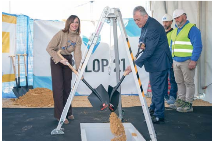
La consejera de vivienda y el alcalde echan tierra en la primera piedra de otra promoción de VPO.

Aunque la comparación entre cuotas hipotecarias y alquileres pueda ser favorable a la compra de la vivienda, no hay que olvidar que el principal obstáculo para quien compra por vez primera es la necesidad de tener ahorrado el equivalente al 28%-32% del precio de compra de la vivienda para hacer frente a la parte no financiada por las entidades financieras (el 20%) y los impuestos y gastos asociados a la compra (entre el 8% y el 12% dependiendo de la zona). Este es el principal obstá-