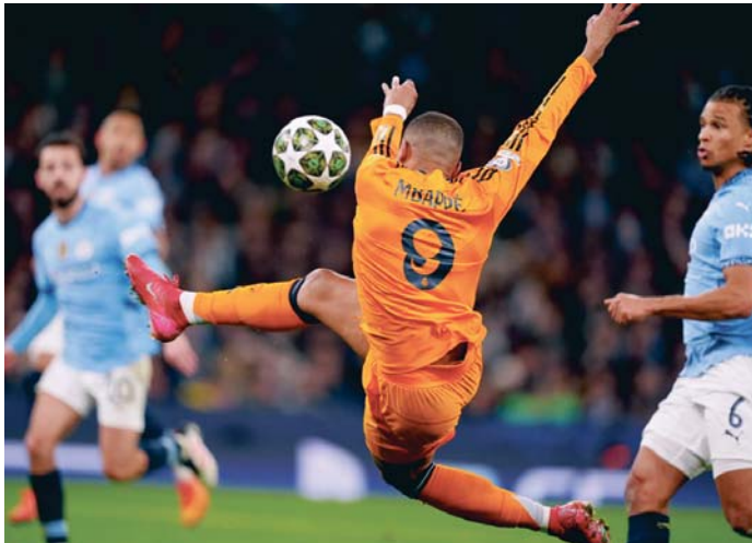
Mbappé remata de forma poco ortodoxa para poner el 1-1 en el Etihad en el marcador.

MÁNCHESTER (R.UNIDO). EFE | Costó, casi hasta el último minuto, pero el fútbol hizo justicia. Un notable Real Madrid, quizá el mejor de la temporada, ganó en el último momento (2-3) un partido que pudo haber sentenciado mucho antes ante el Manchester City, pero en el que sus errores casi le cuestan un gran disgusto. En dos chispazos finales, el Real Madrid tuvo el acierto que le había faltado en el partido de ida del play-off por los octavos de final de la Liga de Campeones. Brahim Díaz, un ex del Manchester City, y Jude Bellingham,