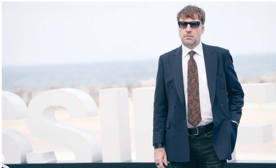
El director Albert Serra posa durante la presentación del documental 'Tardes de soledad' en el Festival de San Sebastián.

Asimismo, en este documental, según el acta, el director aborda la figura del torero "como un auténtico héroe contemporáneo y un artista en constante compromiso con su arte, abordando temas universales como el mie-