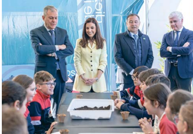
La zona exterior del domo de la Fundación Unicaja acoge actividades infantiles.

En el interior del domo, las nuevas tecnologías tienen un gran protagonismo, a través de una exposición inmersiva pionera a nivel mundial, proyecciones 360, maquetas accesibles inteligentes 3D y gafas de realidad virtual.