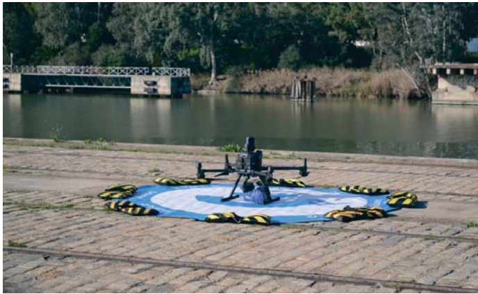
El dron transportando el material sanitario en la prueba piloto desarrollada en el puerto.

El proyecto U-elcome no sólo tiene la mirada puesta en la optimización de la logística portuaria, sino que se enfoca al ámbito sanitario. La prueba piloto mostró cómo los drones pueden transportar material médico esencial, como medicamentos y suminis-