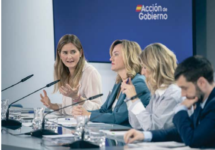
Un momento de la rueda de prensa de ayer en el Palacio de la Moncloa.

Pese al deseo de Díaz de que el SMI quedará exento de tributación en el IRPF, el Ministerio de Hacienda confirmó ayer que los trabajadores que cobren esta renta mínima tendrán que tributar en este im-