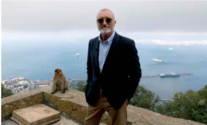
El escritor Arturo Pérez-Reverte, en Gibraltar.

La ironía de su mensaje se entiende en un contexto particularmente sensible para la región. Hace poco se cumplió el primer aniversario del trágico suceso en el puerto de Barbate, donde dos agentes de la Guardia Civil perdieron la vida tras ser embestidos por una narcolancha. Este lamentable hecho, que ha dejado una huella imborrable en