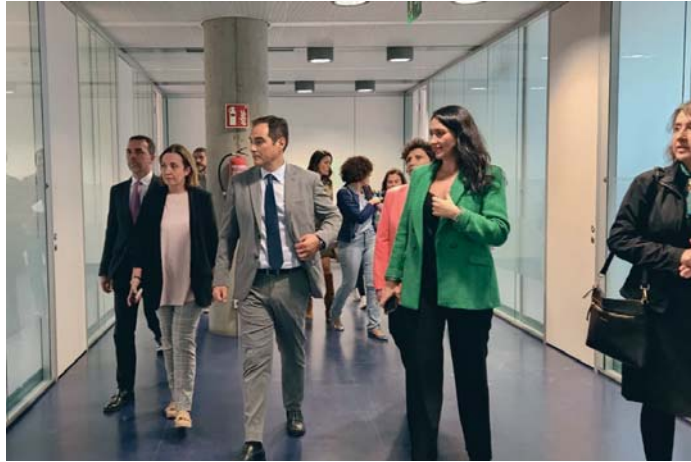
El consejero de Justicia durante una de las visitas a los edificios de la Ciudad de la Justicia.

Asimismo, en diciembre fue adjudicada por 1.405.899 euros (IVA incluido) la redacción del Proyecto Básico y de Ejecución para adecuar el resto de bloques construidos del