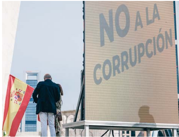
Una concentración para pedir elecciones generales en la Plaza de Castilla.

España está categorizada con 56 puntos entre las 47 “democracias defectuosas”, a 15 puntos de distancia de las 21 “democracias plenas”, cuyo listado lo lidera Dinamarca, con 90 puntos, seguido de Finlandia (88) y Singapur (84)